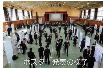
ポスター発表の様子